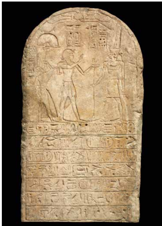
Stèle de donation au nom de Ramsès III Calcaire, bas-relief dans le creux Nouvel Empire, XX e dynastie, règne de Ramsès III, an 25 (vers 1159 av. J.-C.). Provenance: Delta du Nil? Fondation Gandur pour l'Art, Genève, Suisse, inv. FGA-ARCH-EG-0224.

d'autres institutions. La valeur des biens est estimée selon un étalon (sorte de monnaie purement virtuelle), qui permet d'obtenir en échange des denrées d'une valeur équivalente.